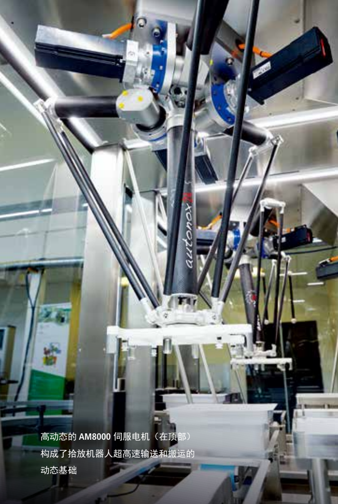
高动态的 AM8000 伺服电机（在顶部）构成了拾放机器人超高速输送和搬运的动态基础