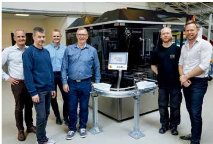
专家团队在新的 NESTOR 玻璃瓶和注射器进给和运输系统前

总部位于丹麦锡尔克堡的 SVM Automatik A/S 公司在其为制药行业开发的运输设备 NESTOR 的设计中采用了高性能的 AX8000 多轴伺服系统。在进行质量管理时，该设备仅需几微秒时间即可完成无菌玻璃容器的质量控制工作。此外，它可以非常灵活、快速地进行转换，并且比以前的型号更容易编程。