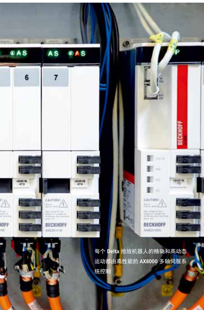
每个 Delta 拾放机器人的精确和高动态运动都由高性能的 AX8000 多轴伺服系统控制